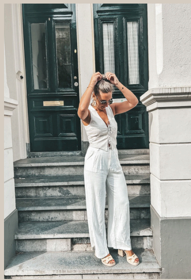
GILET LIN € 54,95 PANTALON AMBER € 39,95