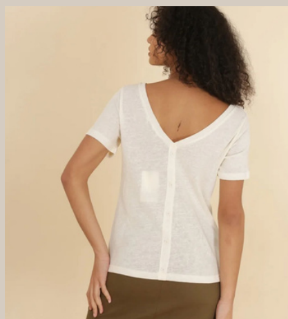
SHIRT JAUNE € 29,95