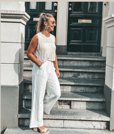
TOP ENZA € 29,95