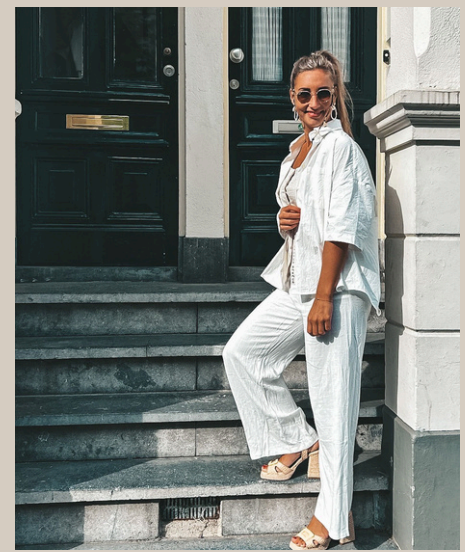
BLOUSE AMI € 49,95