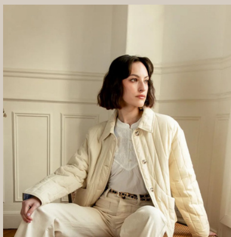
JAS COLLIE € 79,95