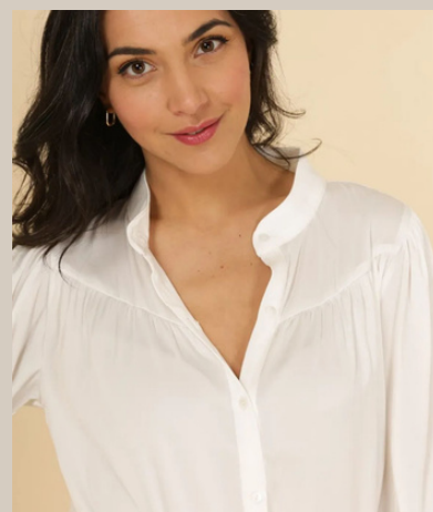
BLOUSE TOLA € 44,95