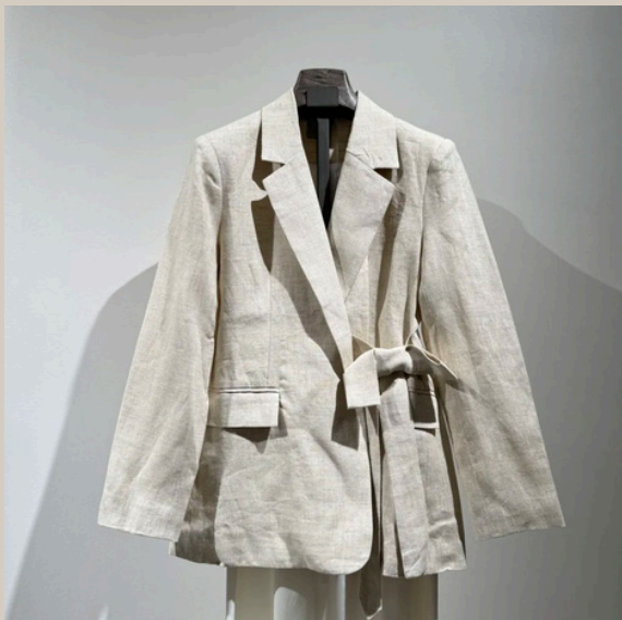
BLAZER SILVI € 109,95